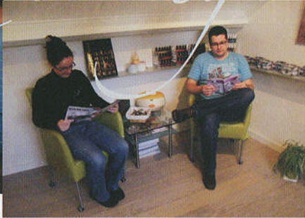
ZITJE VOOR WACHTENDEN IN DE NAGELSTUDIO.