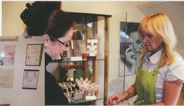
VERKOOP VAN EEN PRODUCT.