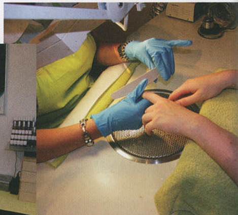
AAN HET WERK. OP DEZE FOTO'S DRAAGT ZE GEEN MONDKAPJE, MAAR IN DE PRAKTIJK VAN ALLEDAG HEEFT ZE EEN KAPJE VAN 3M VOOR.