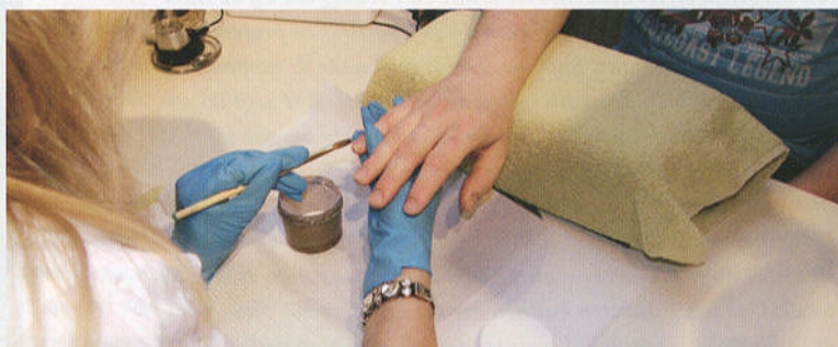
CLOSE-UP VAN EEN MANNENHAND.

"Eigenlijk is het een beetje als grap opgezet om informatie en ideeën uit te wisselen. Het Forum biedt een klankbord om te discussiëren over het vak en van elkaar te leren. Ook mensen van groothandels doen eraan mee. Een grap is het trouwens al lang niet meer, want het is een soort podium van onze branche geworden. Nagelstylisten kunnen er bijvoorbeeld hun werk laten zien en collega's leren elkaar kennen. Behalve dat het leerzaam en leuk